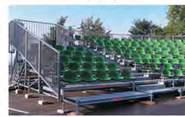
► Tribuna Layher en acero