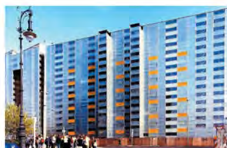
► Sistema Protect