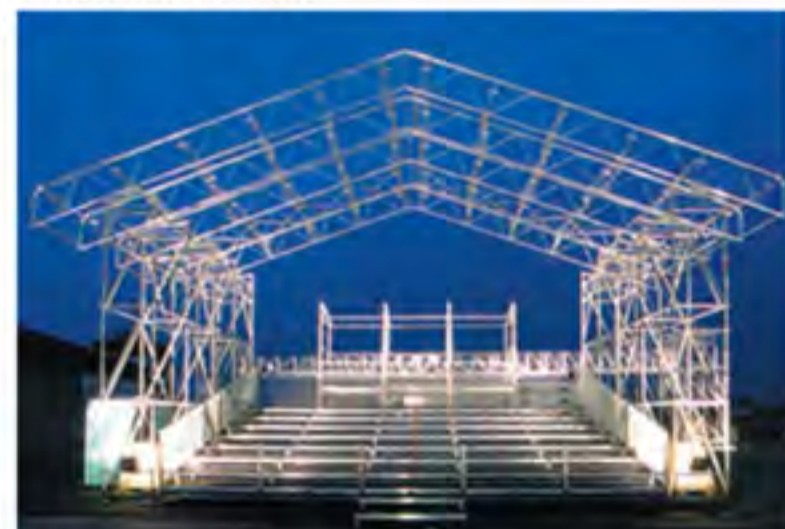
► Cubierta Keder

Disponemos de dos sistemas básicos para la protección de grandes espacios: la cubierta de acero y la cubierta Keder, realizada en aluminio.