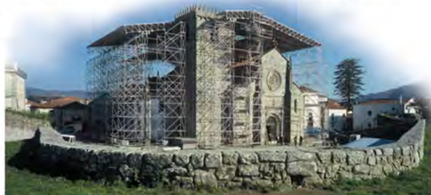
► Cubierta de acero