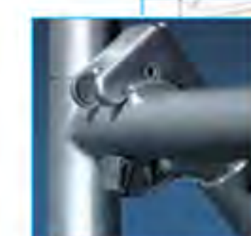
► Encaje de garra

Sistema específico para ejecución de torres de cimbra mediante marcos de acero y barras con encaje de garra rápido.